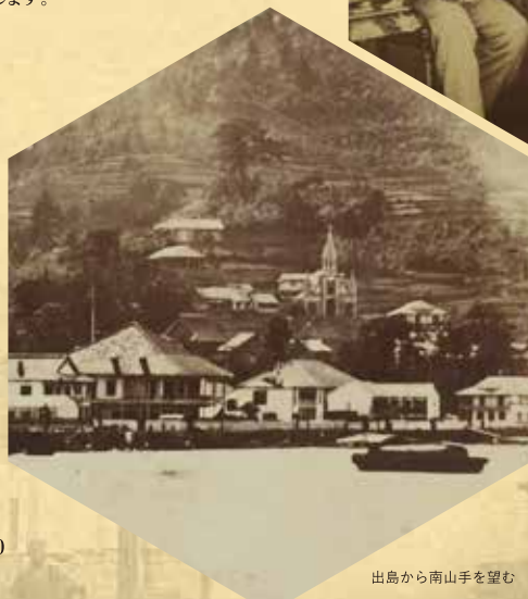
出島から南山手を望む