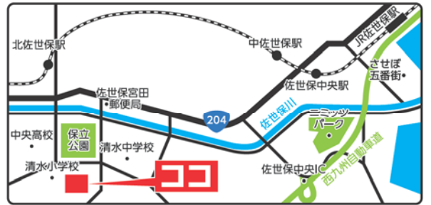
佐世保市総合教育センター 1階 講堂 (佐世保市保立町12-31) ※50台ほど駐車可能