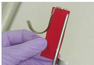
1.咬合紙をホルダーに挟む