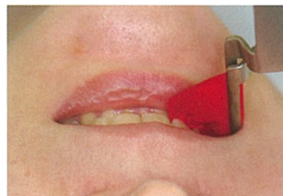
3.噛みあわせを行う

※最後臼歯咬合部分の遠心にホルダーを入れるだけのクリアランスがない症例は適用外です。 また、嘔吐反射(異常絞扼反射)の強い患者へのご使用は注意が必要です。