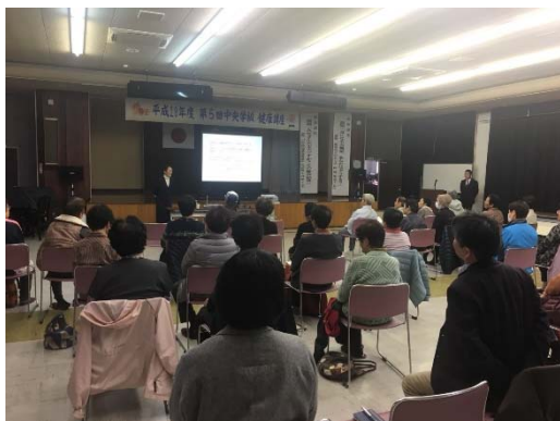
【中央学級健康講座の様子】