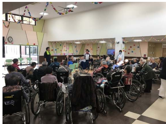
【特別養護老人ホームかわうち レクリエーションの様子】