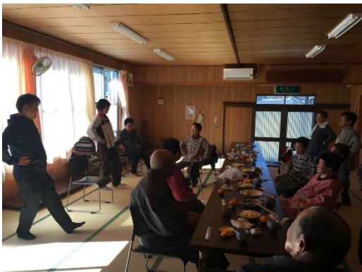
【第七区高齢者サロンの様子】