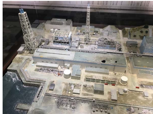
【コミュタン福島 福島第一原発の模型】