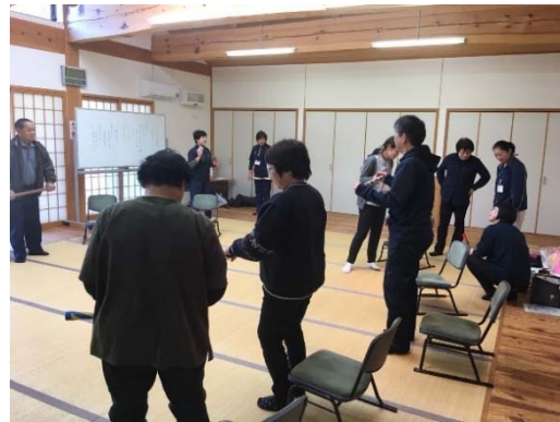
【第一区高齢者サロンの様子】