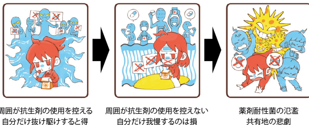
図 2. 社会的ジレンマが耐性菌の氾濫を引き起こす仕組み。

このように抗生剤を使うという行為には、「個人が望む治療」と「世界の耐性菌問題」のどちらをとるかという社会的ジレンマ（個人にとっての最適な行動が、社会全体としての最適な結果に帰着しない状況）があります（図 1）。この問題には、個人と世界を両立する都合の良い回答は存在しません。そのため、患者自身が自分の意思で治療を選ぶことのできる（インフォームドコンセントの発達した）社会では、下の図 2 のような仕組みで、抗生剤の濫用に歯止めがかからない可能性があります。