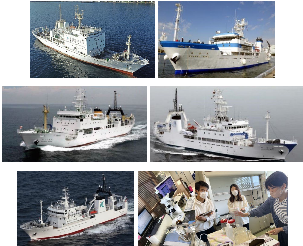
図1 4大学練習船と九州大学のMPs分析室：左上から海鷹丸・神鷹丸・おしよろ丸・長崎丸・かごしま丸・MPs分析室

9. Keiichi Uchida, Mao Kuroda, and Tadashi Tokai. 2022. Comparison of microplastic sampling performance between a neuston net and a manta net. Fisheries Engineering , 59, 19-26. https://doi.org/10.18903/fisheng.59.1_19