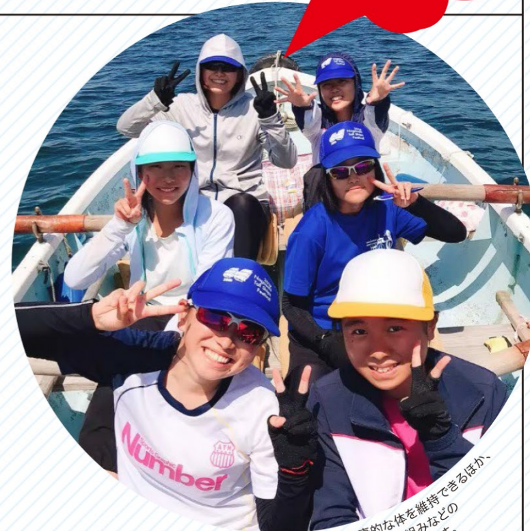
活動場所/時津港 活動日/毎週木曜・金曜・土曜 メンバー数/10人

体力がついて健康的な体を維持できるほか、海峡や船の仕組みなどの知識も身に付きまます。