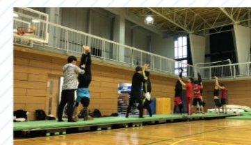
先輩たちの補助の下、バク転やひねり技、車輪などの難しい技も習得。令和元年度の九州学生新人大会2部リーグでは、女子団体2位、男子団体3位の成績を取りました。