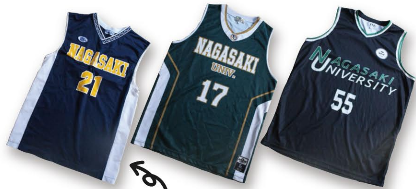
いつ頃のユニフォームなのかご存じのOBの方、いらっしゃいませんか?