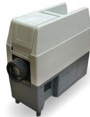
フィルム時代に 使われていた映写機。