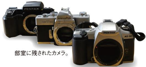
部室に残されたカメラ。