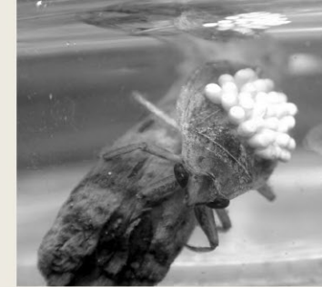
卵塊を背中で保育するコオイムシのオス

「親による子の世話」が知られる節足動物の多くは、母親だけが子育てするのに対し、父親が子育てするのはコオイムシ類やウミゴモ類などごく一部のグループに限られます。この研究結果は、オスによる子育ての進化とメスによる交尾相手の選り好みの密接な関係を示唆しており、動物における家族関係のあり方を解明する重要な知見として評価されています。